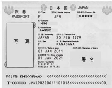
[顔写真ページ見本]